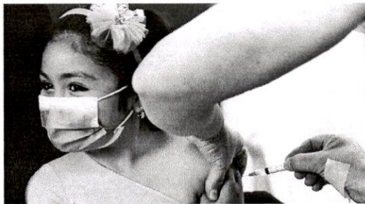
ESQUEMA DE VACINAÇÃO DEVE SER DE DUAS DOSES COM INTERVALO DE 28 DIAS

A Gerência-Geral de Medicamentos e Produtos Biológicos indicou ainda que a vacina aplicada em crianças seja de mesma formulação do que a utilizada em adultos. Além disso, deve ser utilizada também a mesma dose e a mesma posologia.