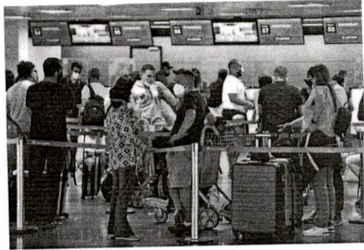
É O MAIOR NÚMERO DE DEPORTADOS EM UM ÚNICO VOO PARA CONFINOS DESDE 2019

Donald Trump, que adotou política anti-imigração, mas passou a ser usada também no governo Biden, quando um número recorde de imigrantes começou a chegar na fronteira dos EUA com o México.